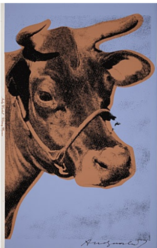
"Cow" Farbsiebdruck auf Tapete 1971/1979

Im Hauptraum und im Basement: "ACCROCHAGE – Neuankäufe und ausgewählte Exponate aus den Beständen"